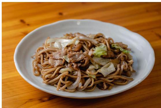
「だるま堂」の焼きうどん